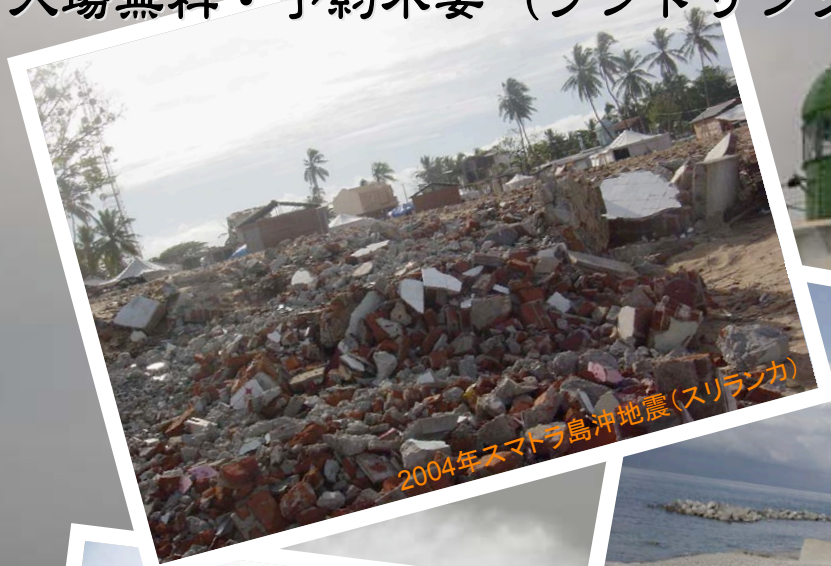
2004年スマトラ島沖地震(スリランカ)