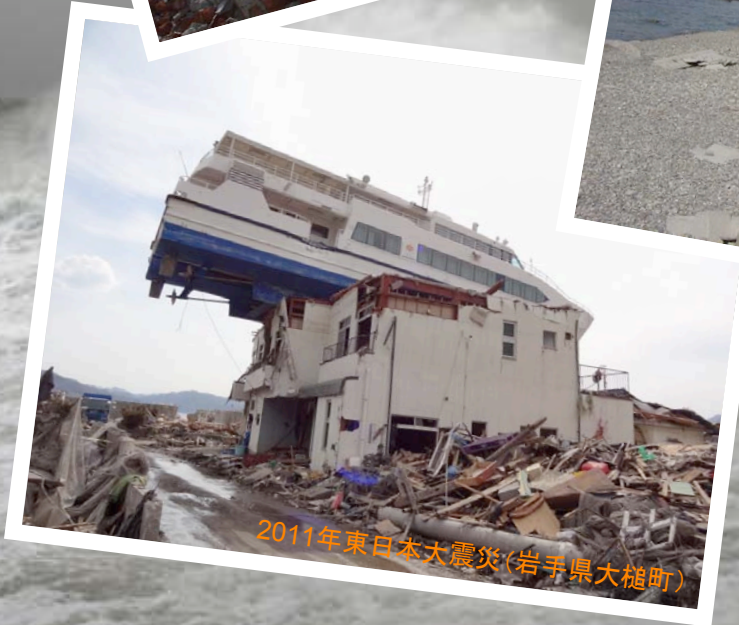
2011年東日本大震災(岩手県大槌町)

2004年スマトラ島沖地震による津波災害, 2008年寄り回り波による富山湾高波災害, 2011年東日本大震災など, 現在もなお, 沿岸域においては甚大な自然災害が発生しています. 東日本大震災における津波被害を中心に, 沿岸域における自然災害について一緒に考えたいと思います. また, 津波の高さとは?, 津波と高潮の違いは? など, 沿岸災害に対する皆様の疑問にもお答えいたします.