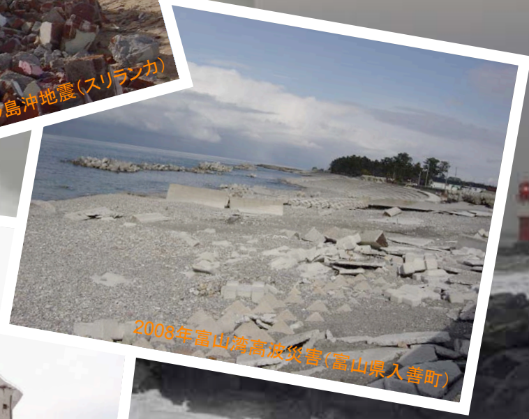
2008年富山湾高波災害(富山県入善町)